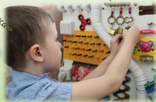
«Крестики и нолики»